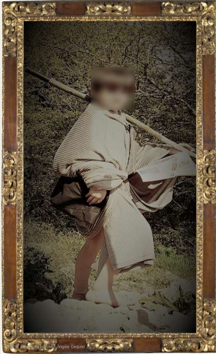
Musée du Louvre - Angèle Dequier