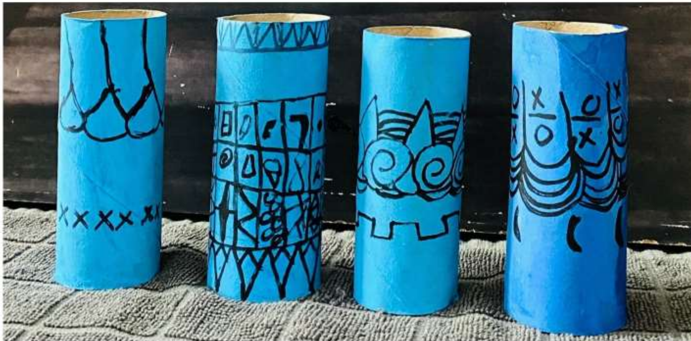
Les 4 vases de Ramsès II (Rose)