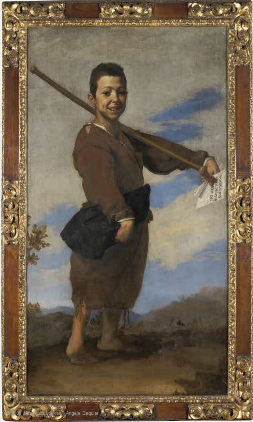
Musée du Louvre - Angèle Dequier