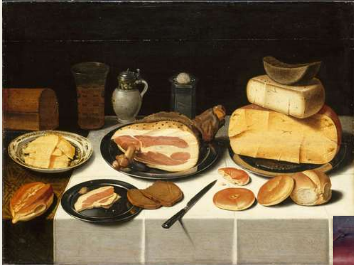
Nature morte au jambon - Floris VAN SCHOOTEN (Elouan)