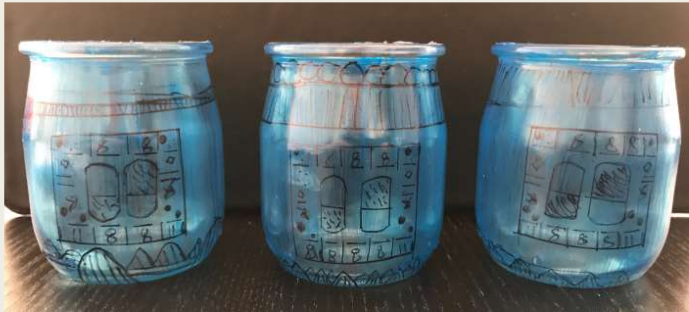
Les vases de Ramsès II (Cassandra)